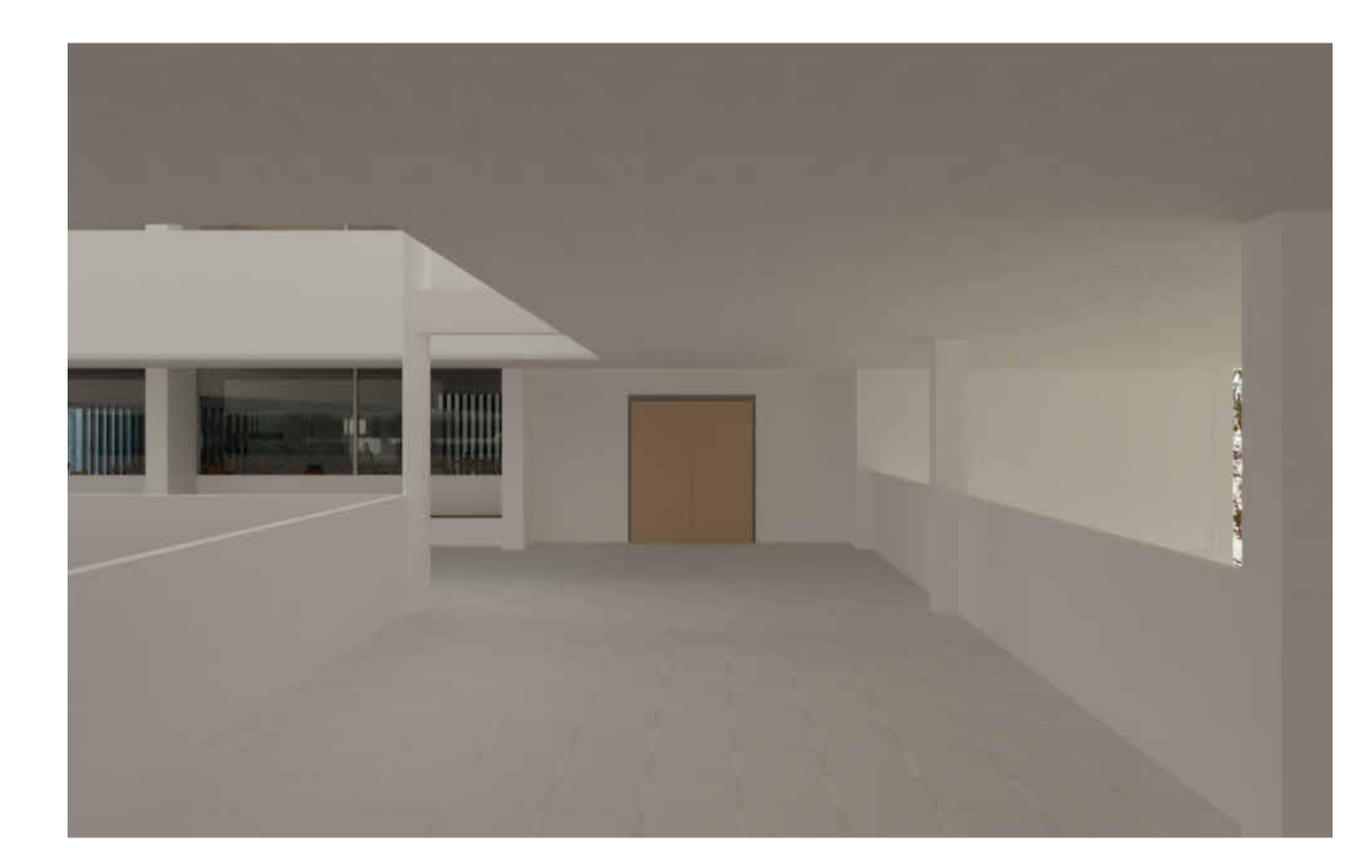
RENDER 3D ACCESO A OFICINAS